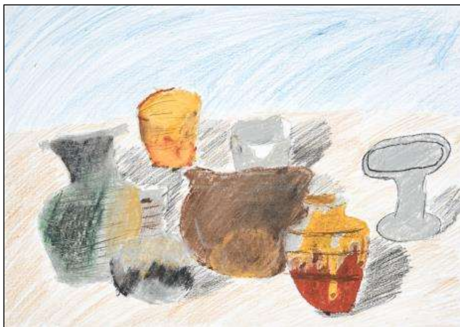
<二宮さん> 入選しました。